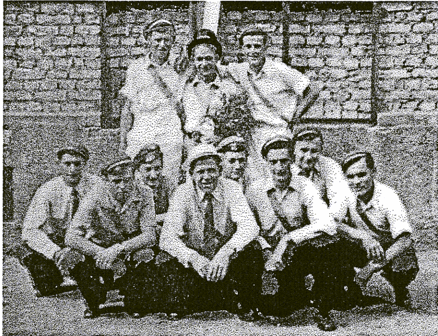
Kerweborsch vun de Sunn 1954