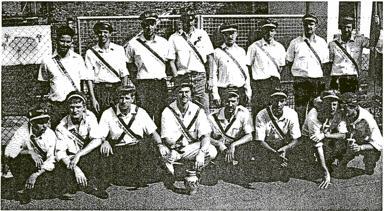
Kerweborsch vum Schitzehof 1991

Und wieder heißt es FEHLERSUCHE in der 92er WAZ-Ausgabe. Wieder hat die Redaktion einen (offensichtlichen) Fehler eingebaut. Wer von der holden Weiblichkeit den Fehler findet und bis Kerwemontags 12.00 Uhr im Gasthaus "Zur Sonne" bei Kerweborsch oder Wirt abgegeben hat, dem winkt wieder ein Eisessen mit einem Kerweborsch nach Wahl. Die Verlosung findet im Anschluß an das Bierfaßrollen statt. Ach, ja, wer's noch nicht wissen sollte: