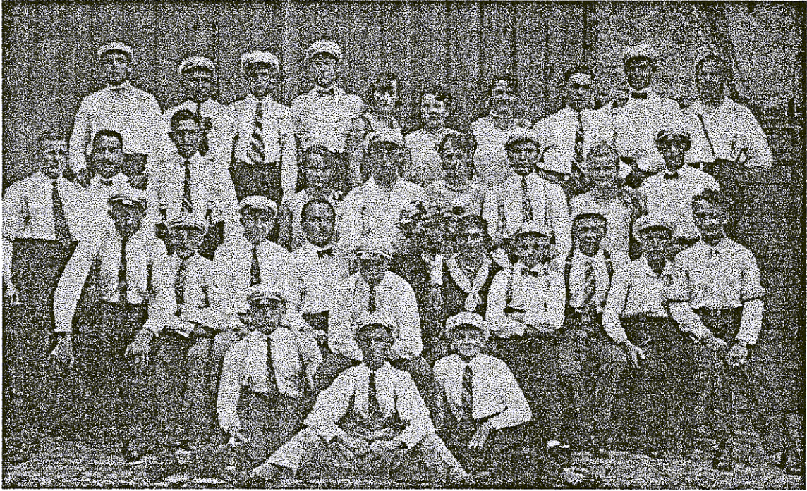
Kerweborsch vun de Sunn 1931