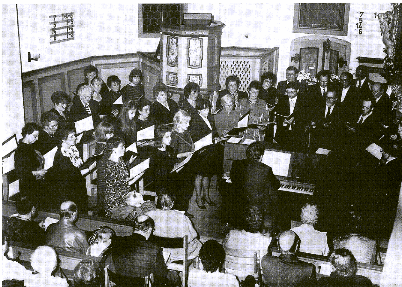
Adventskonzert des Gesangverein Frohsinn in der Worfelder Kirche ( 1992 )

Impressum: Heimat- und Geschichtsverein Worfelden