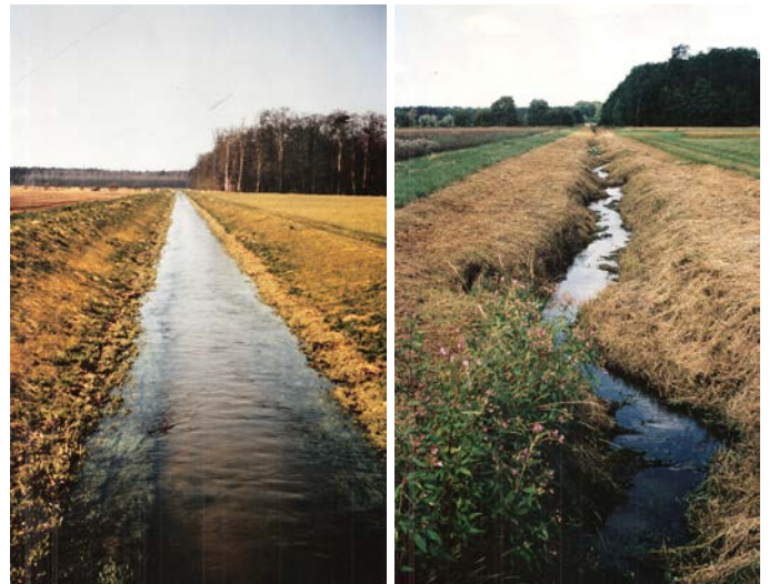
Der begradigte Apfelbach 1962 nach der Rodung am Bachgrund und sein wieder mäandrierender Verlauf rund 20 Jahre später, jeweils aufgenommen auf der Brücke zum Wiesental. 3

gen an dessen Ufern heute die in den 1960er Jahren angelegten Aussiedlerhöfe des Bachgrunds mit ihren ausgedehnten Ackerflächen, doch bis zu den dafür durchgeführten Rodungen nördlich von Worfelden mäanderte dieser Seitenarm des Mühlbachs jahrhundertlang vollständig durch bewaldetes Gebiet.