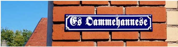
Hausnamenschild „Es Oammehannese“ (Anwesen Klink, Unterdorf 9).