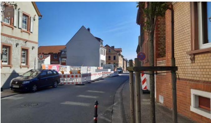
Ein Blick ins Unterdorf von derselben Stelle im September 2021. Nichts erinnert mehr an das imposante Wohnhaus, das hier 130 Jahre lang das Ortsbild Worfeldens mitprägte.

Was sich gegenwärtig in Worfelden abspielt, führt uns vor Augen, wie schnell ein über Jahrhunderte gewachsenes Ortsbild, der Charakter eines Dorfes zerstört werden kann. Die Arbeit und die Geschichte von Generationen weggerissen, ausradiert in wenigen Wochen.