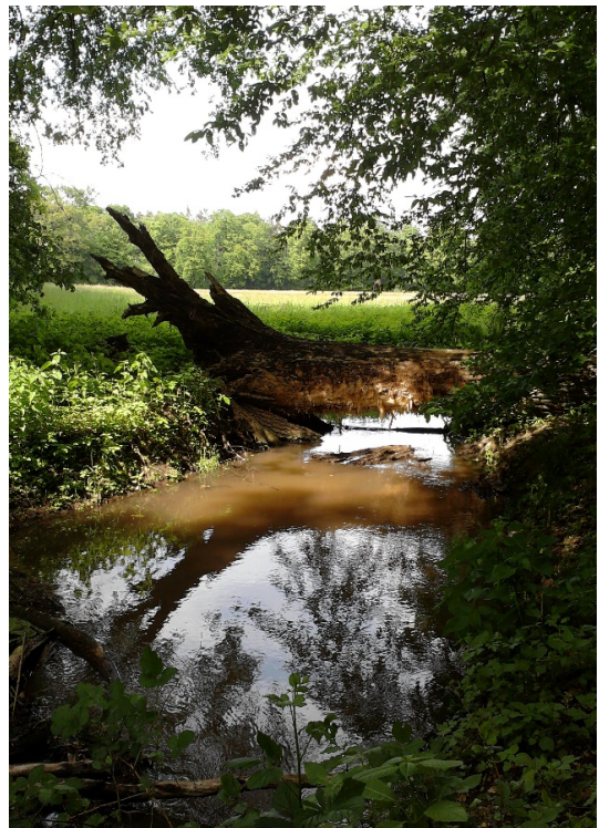
Der Apfelbach im Staatswald Groß-Gerau bei der Hohhäuser Wiese nördlich von Worfelden (Aufnahme im Mai 2012).

Aus dem ursprünglichen Eppenbach wurde somit – als der Bezug zur ursprünglichen Bedeutung verloren ging – im 16. Jahrhundert Eppelbach ('Äpfelbach'). Bis ins 17. Jahrhundert hinein schwankten die ursprüngliche und die mit der neuen Bedeutung versehene Form, bevor sich letztere durchsetzte und durch Anpassungen an die hochdeutsche Schriftsprache ( Aepfelbach und schließlich Apfelbach ) stets weiter von der Ursprungsform entfremdet wurde. Aus dem heutigen Namen ist diese längst nicht mehr zu erschließen.